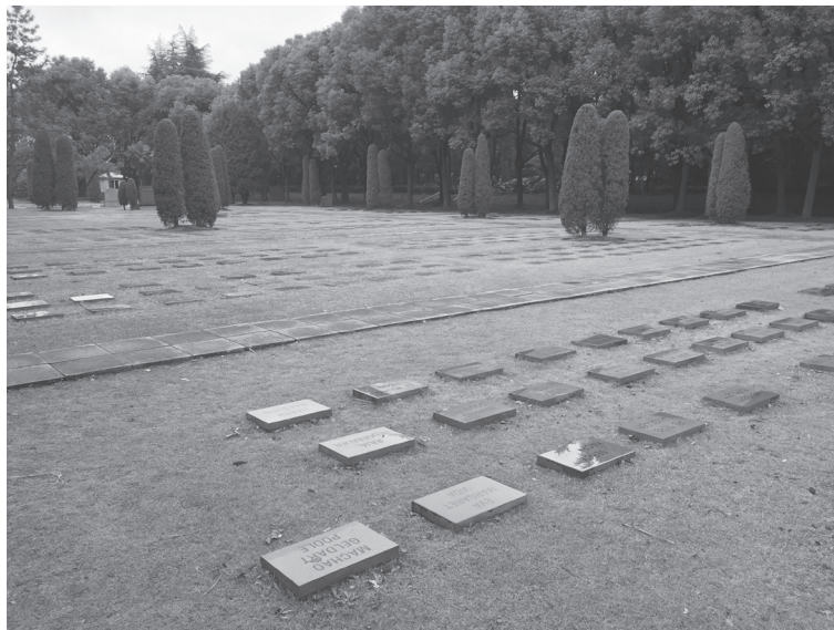
Фото 8 – вигляд сучасного стану ділянки кладовища для іноземців

ділянці кладовища є лише цементні таблички з іменами іноземних громадян. На багатьох табличках відсутні дати народження і смерті, при перенесенні імен допущено багато помилок. Однак саме сюди приходять нащадки мешканців міжнародного Шанхая в пошуках могил своїх прашурів.