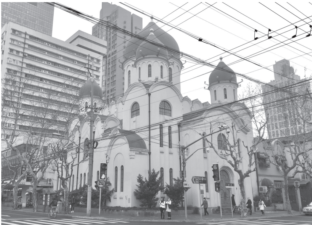
Фото 4 – Кафедральний собор Божої матері “Споручниці Усіх грішних” – сучасний вигляд

Не тільки російськомовна преса публікувала схвальні рецензії на адресу Якова Лихоноса; газети “Чайна Прес”, “Шанхай Таймс” та інші розміщували світлини його робіт із чудовими відгуками про його обдарування.