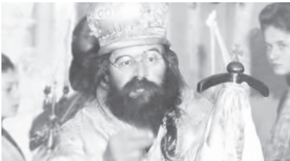
Фото 2 – Іоанн Шанхайський

Після створення Китайської Народної Республіки вихідці з колишньої Російської імперії почали виїжджати із Шанхая: одні на радянських, інші – на міжнародних пароплавах. Вчорашні сусіди і друзі, вони не знали, що їх очікує на іншому березі. Іоанн Шанхайський пішов за своєю паствою на острів Тубабао (Філіппіни), де емігранти отримали тимчасовий притулок. Незабаром він прилетів до Вашингтона, де домігся дозволу на переїзд біженців, або переміщених осіб – Ді-Пі (Displaced Person), як їх тоді називали у США. Закінчив свій земний шлях владика Іоанн у 1966 році; похований у крипті кафедрального собору на честь ікони Божої Матері в Сан-Франциско.