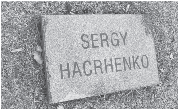
Фото 9 – могильна плита з українським прізвищем на кладовищі для іноземців

Слід зазначити, що перед знесенням старих шанхайських кладовищ у 1950–1960-х рр. міська влада розсилала листи до консульств із пропозицією забрати прах похованих там осіб. Проте робилося це формально, а тому родичі не встигали своєчасно отримати повідомлення, тож лише деякі з них змогли скористатися можливістю перепоховати рідних та близьких.