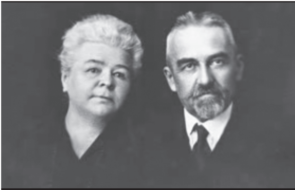
Фото 3 – батьки Іоанна Шанхайського

Не тільки російськомовна преса публікувала схвальні рецензії на адресу Якова Лихоноса; газети “Чайна Прес”, “Шанхай Таймс” та інші розміщували світлини його робіт із чудовими відгуками про його обдарування.