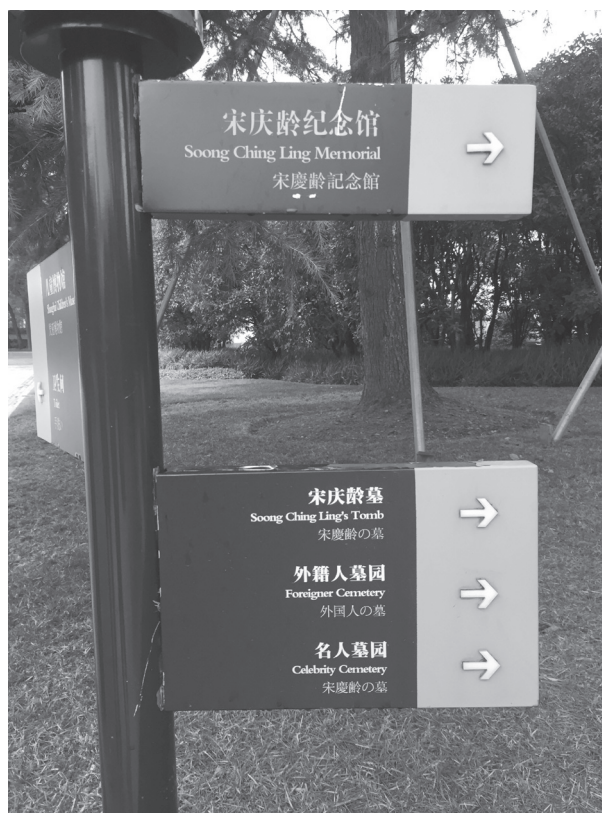
Фото 7 – дороговказ у Меморіальному комплексі Сун Цінлін

Сьогодні на місці колишніх шанхайських кладовищ розташовані парки. Немає могил, куди можна покласти квіти і запалити свічку. Єдиним збереженим міжнародним цвинтарем є Кладовище Почесного голови Китайської Народної Республіки пані Сун Цінлін, вдови Сунь Ятсена (колишнє кладовище Ваньго гунму). Поховання іноземців тут тривали аж до шістдесятих років минулого століття. Але наразі на іноземній