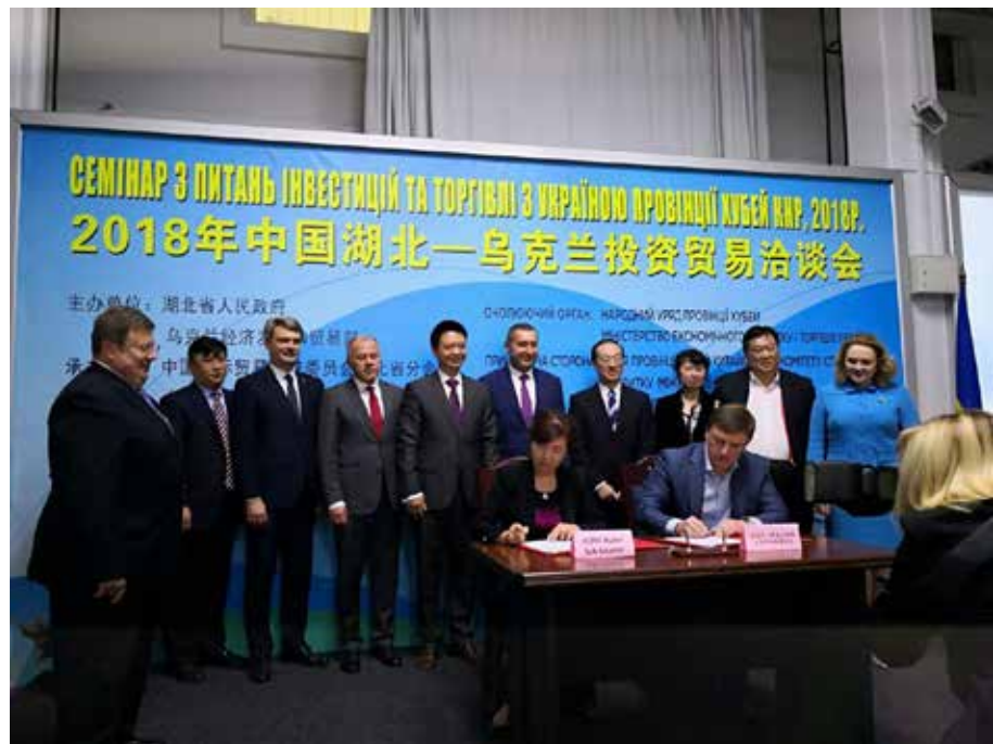
Фото 9. Семинар по вопросам инвестиций и торговли провинции Хубэй с Украиной 14 сентября 2018 г.

5 мая 2019 года состоялась Презентация проекта международной закупки ичанского чая. В этой презентации приняли участие дипломаты и покупатели из Марокко, Кореи, России, Армении и других стран мира, в результате чего было подписано несколько договоров на покупку до 9 тысяч тонн чая общей суммой 110 млн. долларов. Среди этих договоров также был договор о закупке чая, подписанный Хубэйской компанией экологического сельского хозяйства Чэ Си и компанией Жива [2019茶叶... 2019].