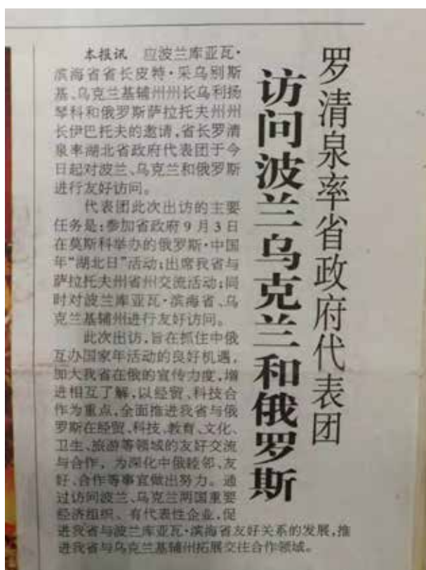
Фото 1. Хубэйская правительственная делегация во главе с губернатором провинции Хубэй Луо Цинцюанем прибыла с дружественным визитом в Польшу, Украину и Россию. Хубэй жибао от 24 августа 2007 г.

дружественным визитом, целью которого было расширение сфер сотрудничества с Киевской областью [湖北年鉴2008, 273]. Хубэйская компания Хоуван и Институт проблем материаловедения НАН Украины подписали Соглашение о внедрении технологий и расширении сфер сотрудничества. Хубэйская компания комплектного оборудования и Национальный олимпийский комитет Украины заключили Намерение о строительстве спортивных сооружений, автошоссе и гостиниц. Правительство провинции Хубэй подчеркивало необходимость углубления сотрудничества между хубэйскими и украинскими научными учреждениями путем оказания технических услуг, привлечения акционеров и задействования интеллектуальных ресурсов [关于... 2007].