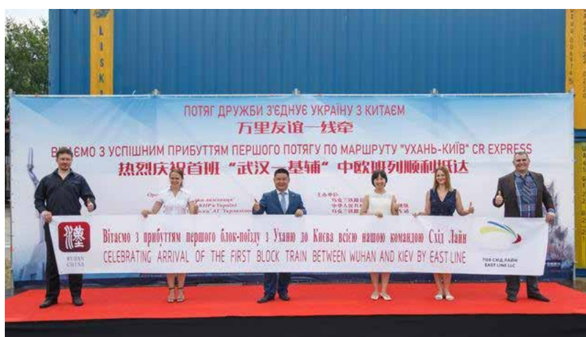
Фото 10. 6 июля 2020 года в Украину прибыл первый китайско-европейский контейнерный поезд «Ухань–Киев»

Еще одним важным событием в отношениях между Хубэем и Киевом стало прибытие первого китайско-европейского контейнерного поезда «Ухань–Киев» в Украину 6 июля 2020 года, который встречали представители Китая и Украины на станции Киев–Лиски [直达... 2020]. По этому маршруту в Украину доставлялось сырье для химической промышленности (английская соль), сельскохозяйственная техника (дождевальные машины), а также алюминиевые рамы, шприцы, сумки и т.д. На обратном пути в Ухань из Украины было доставлено молоко, подсолнечное масло, вино, пиво, хлеб и сыр [首班... 2020].