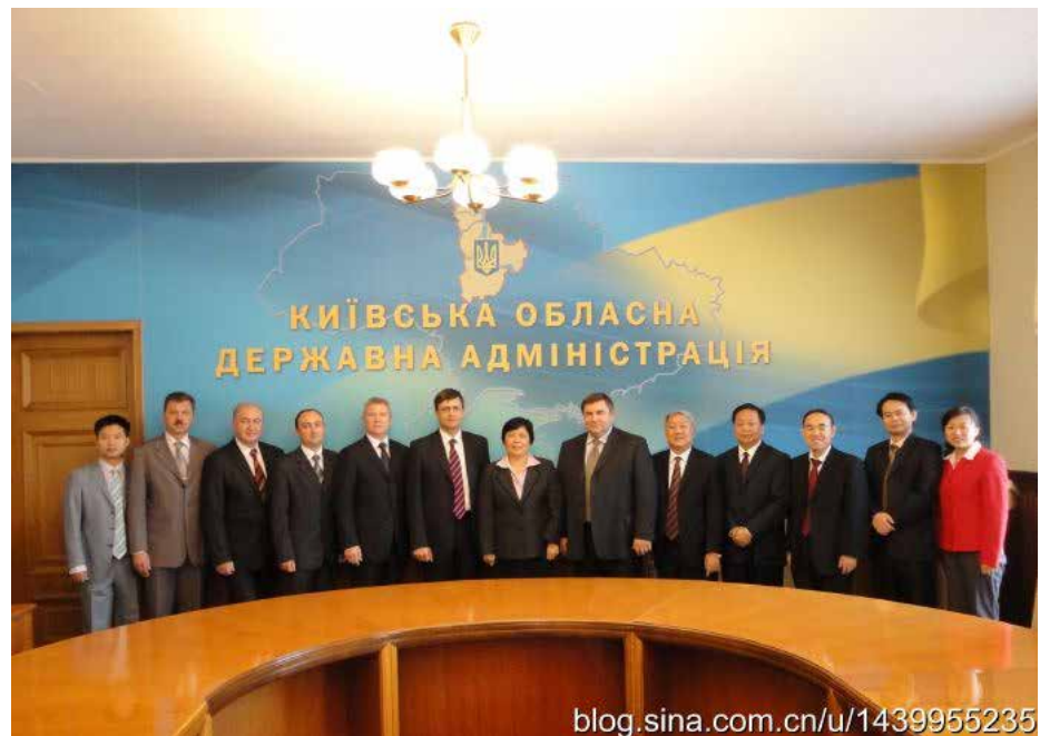
Фото 2. Хубэйская дружественная делегация в Украине в ноябре 2010 г.

В сентябре 2010 г. замруководителя Постоянного комитета ВСНП пров. Хубэй Цзян Даго (蒋大国) возглавил дружественную делегацию, прибывшую в Украину. Делегация посетила Киевский городской совет, областную государственную администрацию, а также культурно-художественную школу Киевской области. Стороны пришли к общему выводу о необходимости установления долгосрочного и эффективного сотрудничества, регулярного обмена визитами, а также обмена студентами [湖北省友好代表团近日... 2010]. В этом же году между Хубэйской компанией Ляньфэн и Киевской областью был подписан Договор о сотрудничестве в области выращивания овощей на территории общей площадью 30 га, а также об открытии фабрики для переработки сельскохозяйственных продуктов [湖北省农垦... 2011]. В 2011 году технические сотрудники компании Ляньфэн успешно завершили экспериментальную посадку пекинской капусты, огурцов, перцев, помидоров, вигны китайской в китайско-украинском показательном сельскохозяйственном парке [蔡志文, 徐章2011].