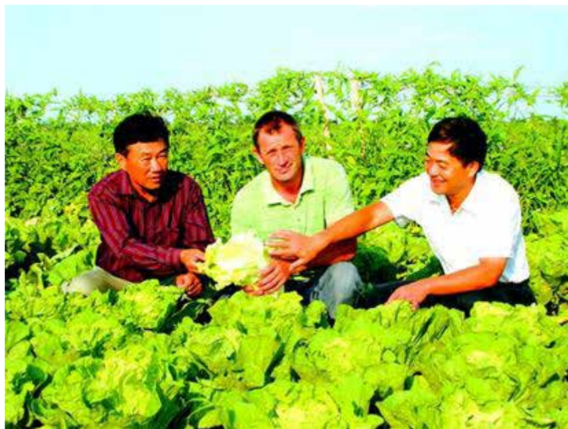
Фото 3. В 2011 году технические сотрудники компании Ляньфэн успешно завершили экспериментальную посадку овощей в показательном китайско-украинском сельскохозяйственном парке