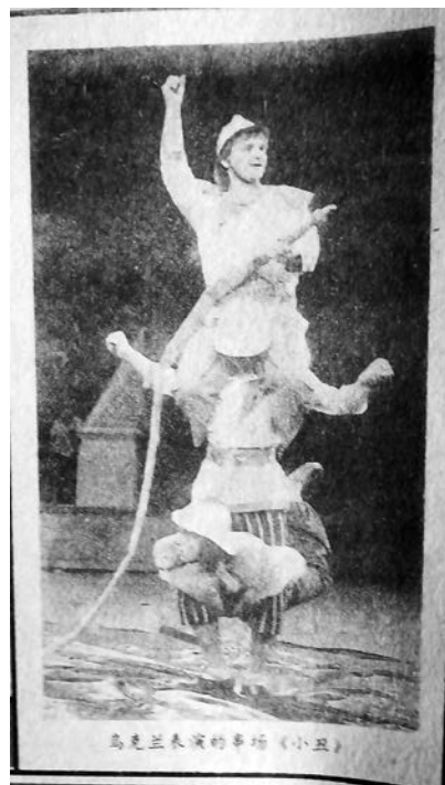
Рис. 8. Украинские артисты на первом Уханьском международном фестивале циркового искусства 1992 года. Чанцзян жибао от 10 сентября 1992 года

Активную роль в обмене между Хубэем и Украиной сыграли и деятели искусства. С 1992 года до сих пор в Ухане через каждые два года регулярно проходили Уханьский международный фестиваль циркового искусства. В этих мероприятиях принимали участие и украинские артисты: клоуны, танцоры и танцовщицы, фокусники и т. д. Их замечательные выступления привлекают внимание китайских зрителей.