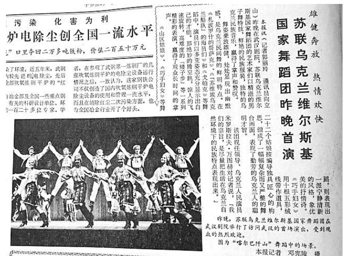
Рис. 4. Советский Ансамбль танца Украины имени Павла Вирского дал первый концерт в Ухане. Хубэй жибао от 6 ноября 1986 года

В 1987 году связь между обществами дружбы Китая и СССР восстановилась, обе стороны начали обмениваться визитами. В апреле того же года председатель президиума Украинского общества дружбы и культурных связей с зарубежными странами (УОДКС) В. Оснач возглавил делегацию, посетившую Хубэй [湖北日报 от 19 апреля 1987 г.]. Во время своего визита в Хубэй Оснач Василий Павлович обратился к ответственным лицам обществ дружбы по всей стране и руководителям провинции Хубэй, заявив, что надеется на установление дружественных отношений УССР и Киева с провинцией Хубэй и городом Ухань. В марте 1988 года Народное общество дружбы с зарубежными странами провинции Хубэй и УОДКС официально возобновили контакты [湖北省档案馆SZ034-013-0737-0006 关于湖北... 1989].