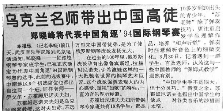
Рис. 9. Хорошие украинские учителя создают блестящих китайских учеников. Чанцян жибао от 5 апреля 1994 года

За этот период, благодаря многолетней истории дружественных обменов и взаимодополняющей промышленной структуре, Украина и Китай установили и укрепили побратимские отношения между провинциями и областями, городами, районами и учебными заведениями, наладили сотрудничество и взаимодействие в сфере политики, экономики и торговли, науки и техники, гуманитарных исследований, образования, культуры и т. д., где достигли заметных результатов. Обе стороны поддерживали частые кадровые обмены, обучили множество украинских и китайских специалистов, а также содействовали профессиональному развитию хубэйских эмигрантов в Украине. Эти молодые люди, несомненно, станут главной опорой китайско-украинских дружеских отношений в XXI веке.