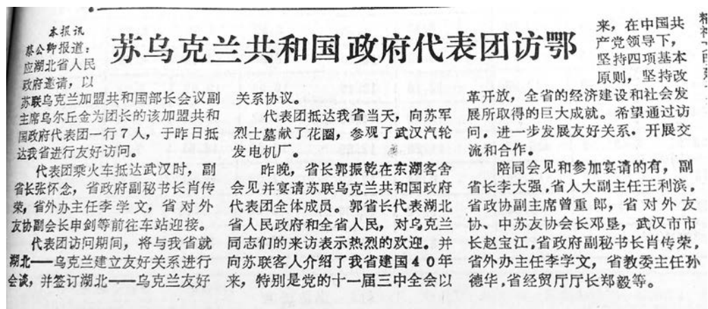
Рис. 6. Правительственная делегация УССР прибыла с визитом в провинцию Хубэй. Хубэй жибао от 26 февраля 1990 года

19 октября того же года Ухань и Киев официально стали городами-побратимами. С тех пор Хубэй и Украина постоянно устраивают кадровые обмены, также между ними активно развивается сотрудничество в сфере экономики, культуры, внешней торговли и пищевой промышленности.