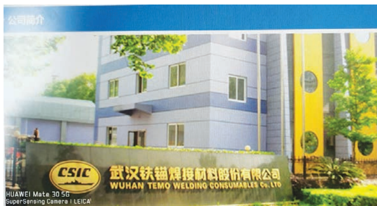
Рис. 7. Уханьская акционерная компания по производству сварочных материалов «Якорь». http://www.whtm.com.cn

В 1992 году Хубэй и Украина также осуществляли и техническое сотрудничество. В этом же году производственная база сварочных материалов для судовых систем в Китае: Уханьская акционерная компания по производству сварочных материалов «Якорь» заимствовала из Украины производственную линию порошковой электронной проволоки. Новая продукция получила одобрительную оценку классификационных обществ разных стран [陈家本... 2007]. С 7-го по 23-е мая 1992 года Украинский фольклорно-этнографический ансамбль «Калина» в составе 31 человека прибыл в Хубэй с дружественным визитным выступлением [湖北省志：外事侨务 1996, 328].