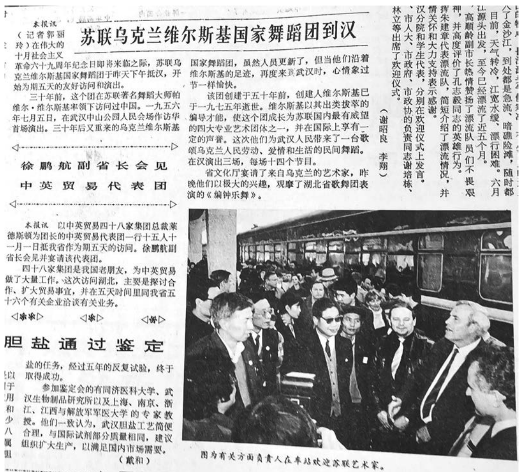
Рис. 3. Советский Ансамбль танца Украины имени Павла Вирского прибыл в Ухань. Хубэй жибао от 5 ноября 1986 года

4 ноября 1986 года, через 30 лет после первого выступления в Ухане в 1956 году, город опять посетил советский Ансамбль танца Украины имени Павла Вирского [湖北日报 от 5 ноября 1986 г.]. Ансамбль трижды выступал в Ухане и получил невероятные отзывы. Тогда мне тоже посчастливилось протиснуться в коридор большого зала и насладиться виртуозным выступлением украинских артистов. После завершения выступления зал разразился бурными аплодисментами, которые еще долго не прекращались. И лишь после дополнительного представления, которое длилось полчаса, аплодисменты постепенно утихли.