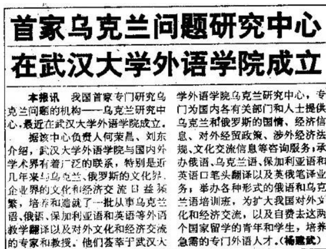
Рис. 2. Первый в Китае исследовательский центр по изучению проблем Украины был создан в Уханьском университете. Хубэй цинци бао от 27 октября 1992 года