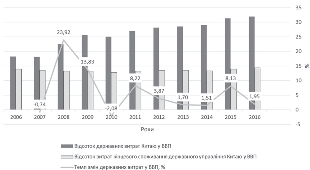
Рис. 3. Частка витрат держави у ВВП КНР